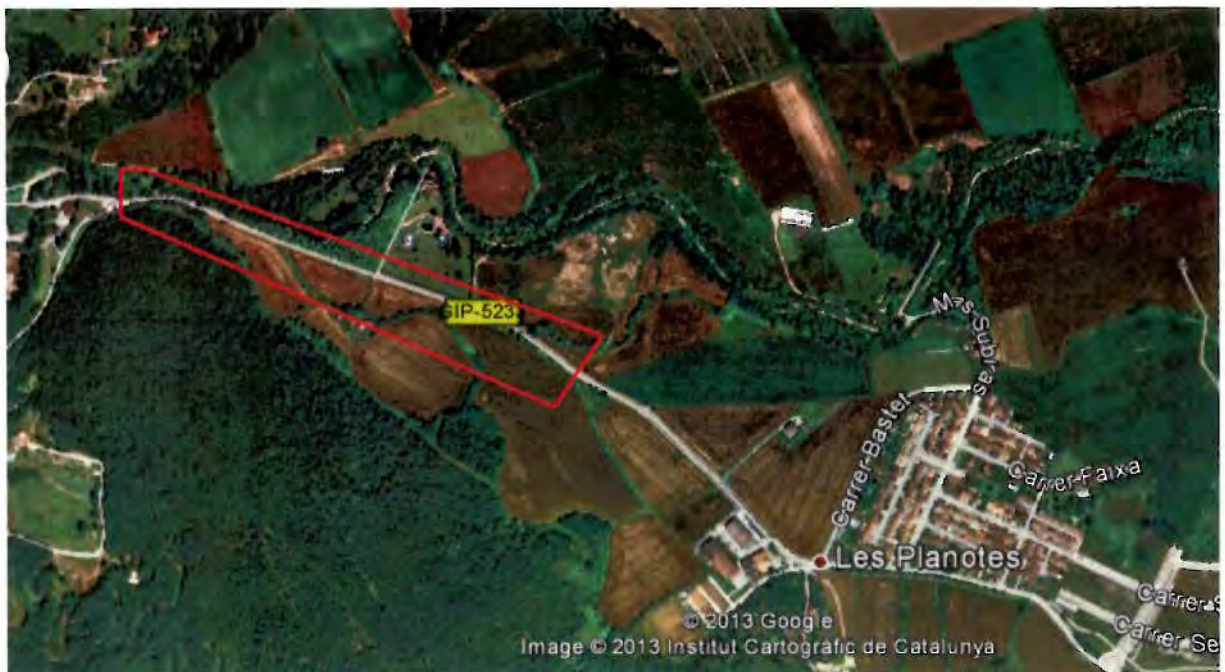
Àmbit de la Ctra. de Riudaura Delimitació de Servituds

L'àmbit inclou els terrenys privats que estan en sòl no urbanitzable a cada banda del tram traspasat de la GI-P-5223. En concret, es tracta del tram de la carretera de Riudaura des de el seu punt d'enllaç amb la carretera de la Pinya, GIV-5224, a la banda oest, i fins abans del futur enllaç del traçat previst inicialment amb la nova carretera C-63 ( nova carretera c 37 de vic a Olot, Variant d'Olot) .