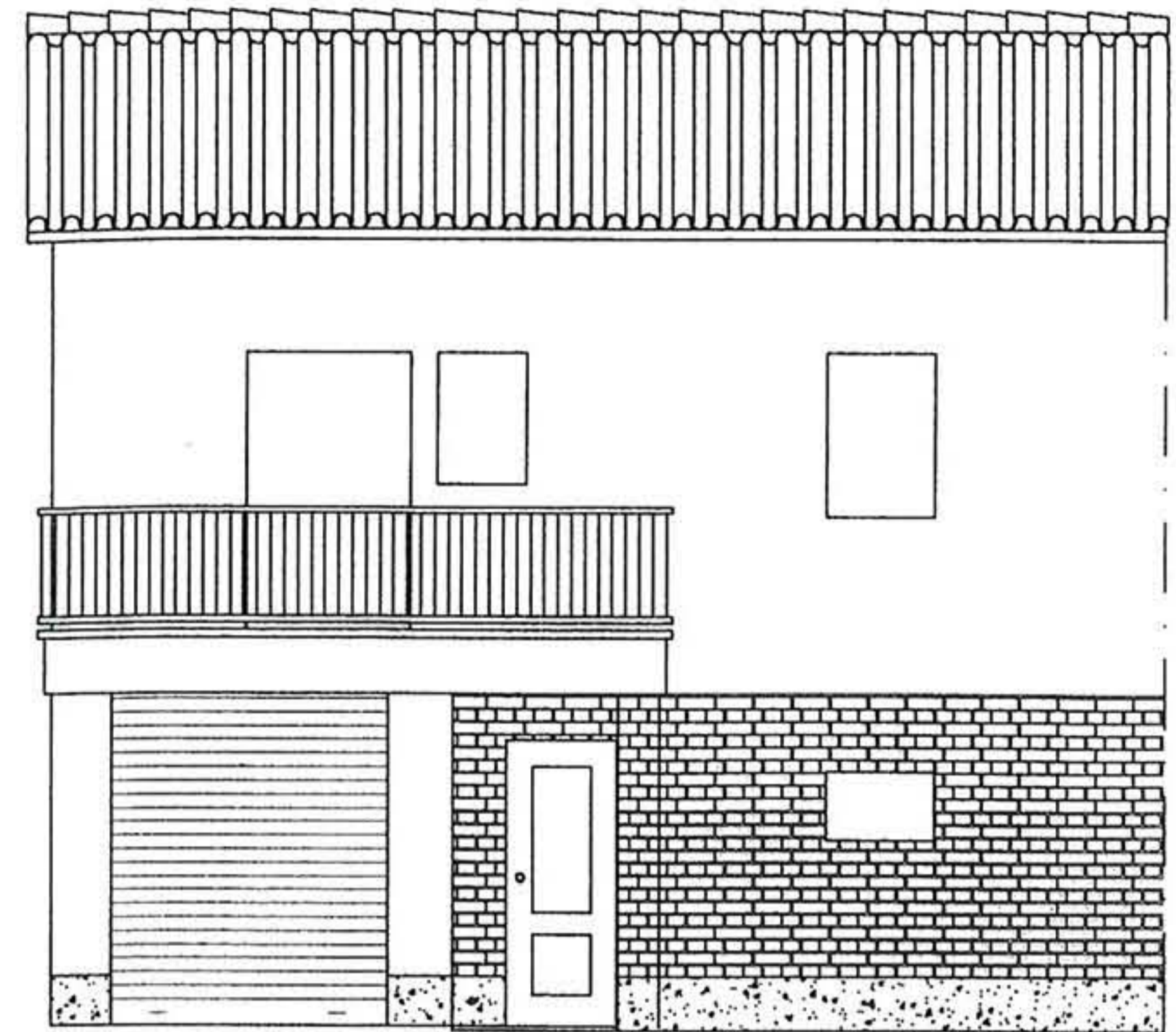
CARRER VOLCÀ SANTA MARGARIDA I CARRER VOLCÀ MARTINYÀ FAÇANA PRINCIPAL. ESTAT MODIFICAT.