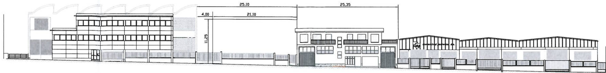
ALÇAT FAÇANA C/ TERRASSA E. 1/500