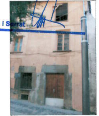
C. Verge del Portal, 26