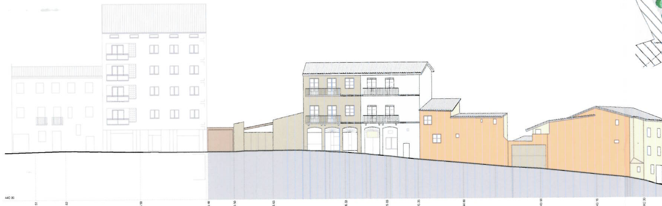
ALÇAT B C/ SANT BERNAT - C/ VERGE DEL PORTAL

Generalitat de Catalunya Departament de Territori i Sostenibilitat Direcció General d'Ordenació del Territori i Urbanisme