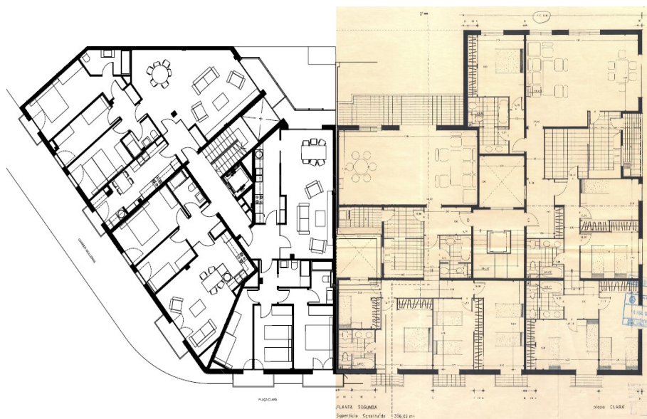
Fig. 4: Composició planta primera del front edificatori a la Plaça Clarà. Edifici Plaça Clarà número 1A i 1B.